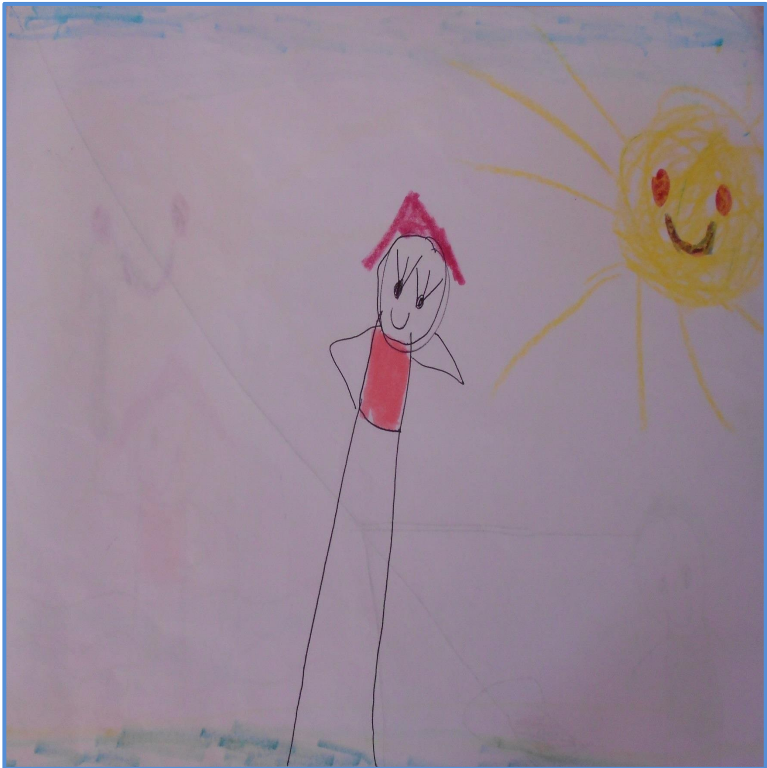
Έτσι λοιπόν ο δράκος φόρεσε το δαχτυλίδι και μεταμορφώθηκε σε ένα όμορφο κορίτσι