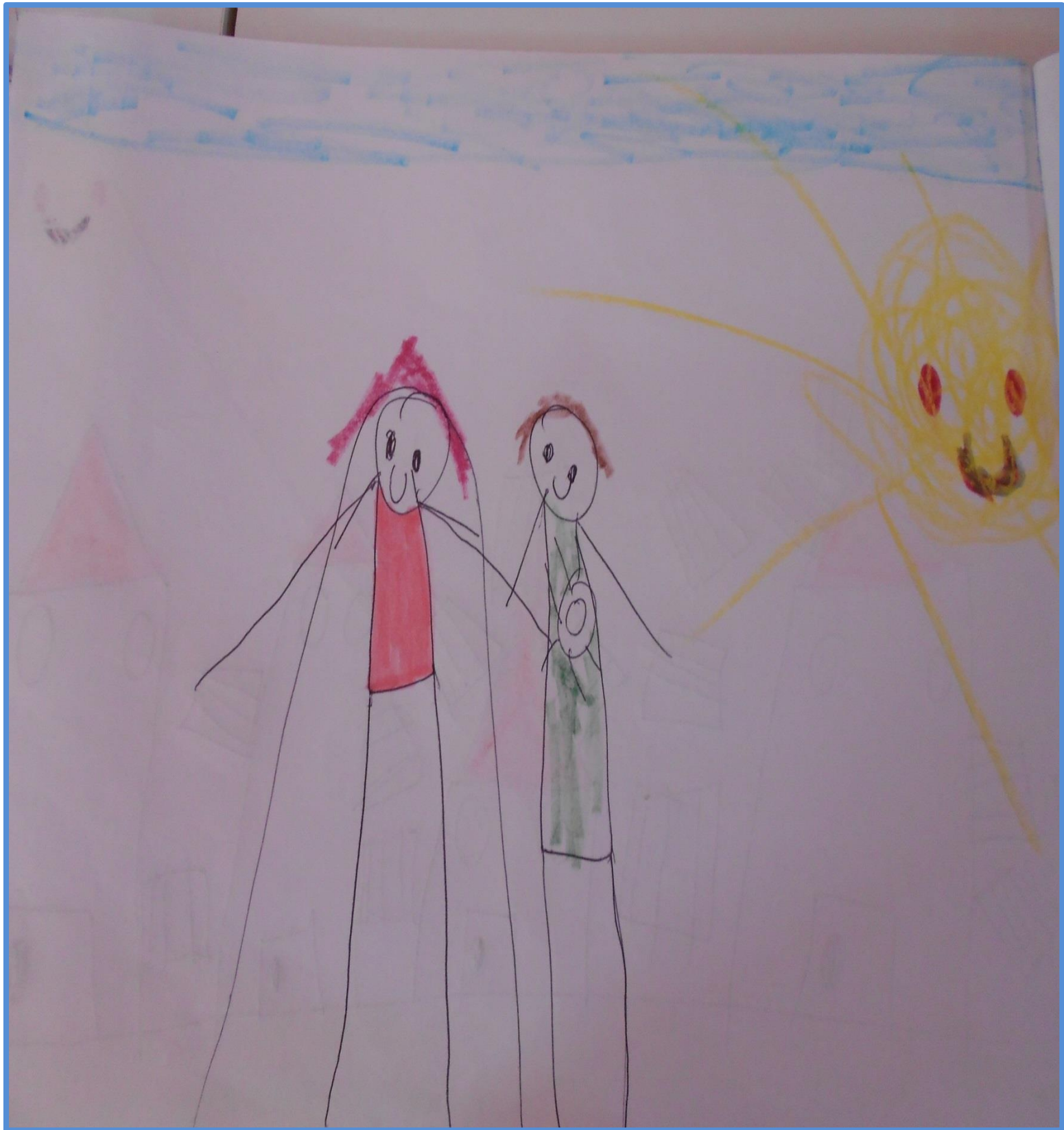
Και έζησαν αυτοί καλά κι εμείς καλύτερα.