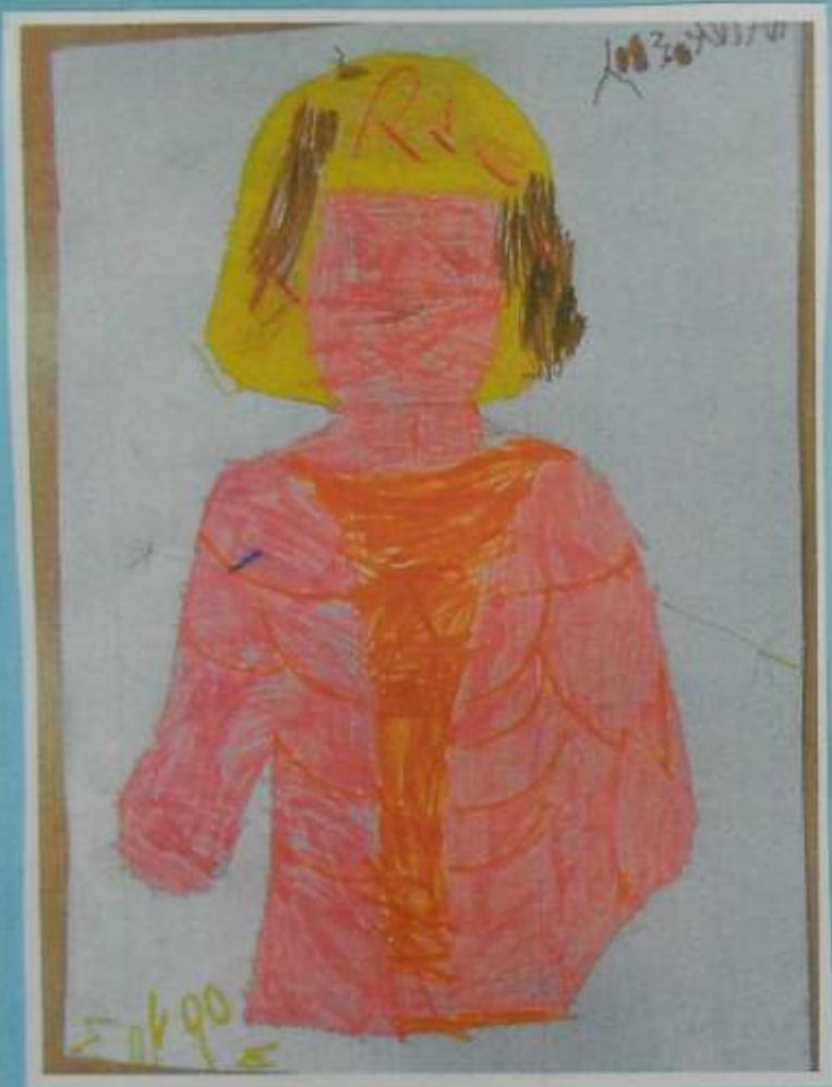
1 Μυϊκό σύστημα