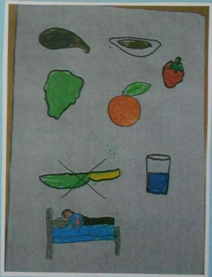
ΚΑΛΕΣ ΣΥΜΒΟΥΛΕΣ 12